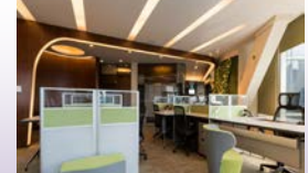
各州營業地址租賃