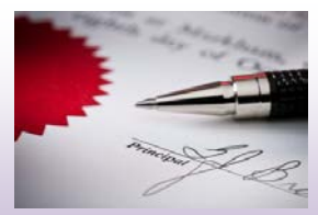
美國本地銀行開戶