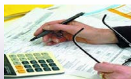
美國各式稅務申報