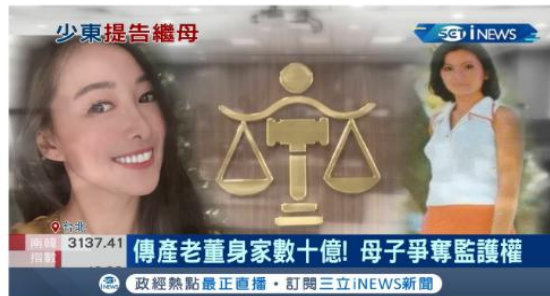
名模丈夫控繼母奪9成家產 傳產老董身家數十億母子爭奪監護權 三立新聞 2021.4.7