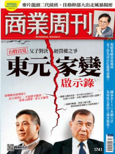
東元家變啟示錄—台股首見，父子對決經營權之爭 商業周刊第1741期 2021.3.24

東元家變啟示錄：台股首見，父子對決 東元電機經營權之爭！ 長期思維：要有投資未來、傳承思維，做出能流傳後世的成就！