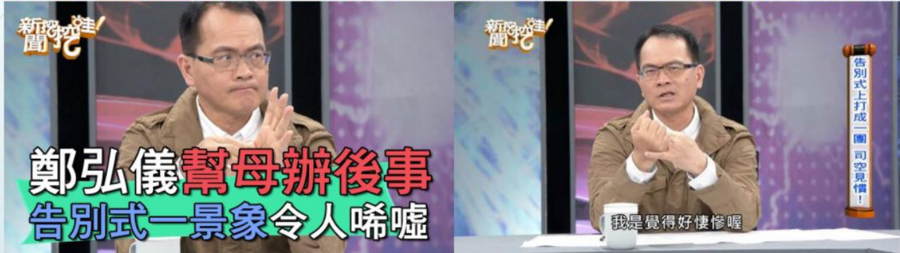
【新聞挖挖哇】鄭弘儀幫母辦後事 告別式一景象令人唏噓 2021.5.5

親人爭遺產,不准遺體下葬!告別式上打成一團,根本司空見慣! 身後事 不規劃 毀了一家人!千金難買早知道傳承規劃真的要趁早!