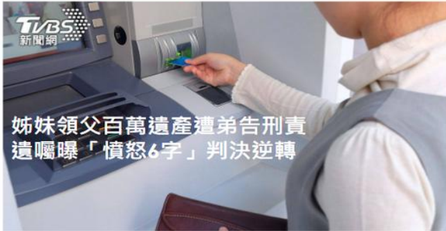
姊妹領父百萬遺產遭弟告刑責 遺囑曝「憤怒6字」判決逆轉

家族財富傳承 與 家族企業布局 萬智環球家族辦公室 不孝兒告姊妹盜領遺產！聰明老父“預立遺囑”超前部署解難題！ 身後事不規劃 毀了一家人！千金難買早知道 規劃千萬要及早！