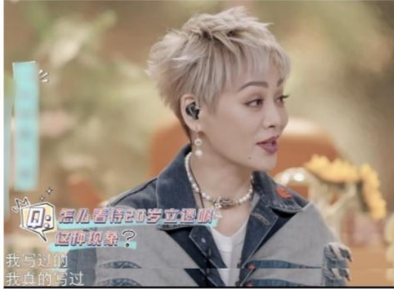
寧靜談「年輕人立遺囑」怦然心動20歲youtube

家族財富傳承 與 家族企業布局 萬智環球家族辦公室 張國榮 劉德華 都傾倒的美貌...瀟灑「寧靜」20歲就立過遺囑... 智慧與美貌兼具的女神！內心強大 為家人則強 智慧理財規劃！