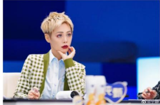
「寧靜」曝20歲就立遺囑 民視新聞 2021.5.5 翻攝自寧靜微博